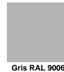
Gris RAL 9006